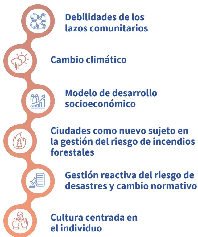
Ilustración 1. Escenarios y desafíos prioritarios para la gestión del riesgo de desastres con perspectiva comunitaria y territorial

Finalmente, ante un contexto de desafíos cambiantes, se demanda que las iniciativas desplieguen una alta capacidad de adaptación y flexibilidad en sus procesos. Esta adaptabilidad es crucial para enfrentar de manera efectiva el rápido aumento del riesgo de desastres en el país, impulsado por los efectos del cambio climático y los cambios normativos e institucionales a nivel local, subnacional y nacional.